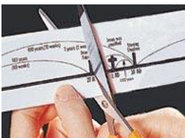
Why would anyone cut away an important part of this prophecy?